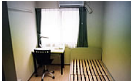
間取りはイメージです